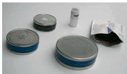
Radona ogle detektors 10

Ievērojot, ka radona līmenis mainās laikā un arī ir atkarīgs no sezonas, tad labākais risinājums ir izvietot detektorus mērīšanai ilgāku periodu (vismaz 6 mēneši), kas raksturo vidējo gada vērtību.