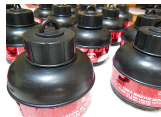
Radona elektrets 12